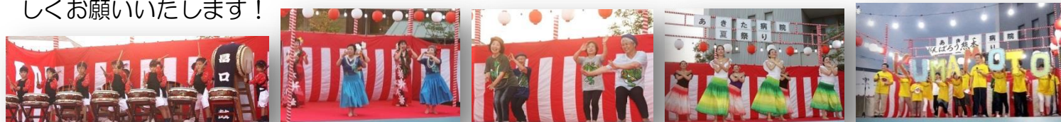
畠口みのり保育園さま

開催にあたり、ボランティアの方々や地域の方々、駐車場やテントの借用では JA 熊本市飽田支店様や飽田中学校様など、たくさんのご協力をいただきまして本当にありがとうございました。『入院患者様やデイサービス、グループホームの施設利用者様に、少しでも外の気分や祭りの活気を味わって頂きたい』そして『患者様のご家族や地域の皆様と一緒に楽しい時間を過ごしたい』という思いで始めたこの夏祭り。来年もたくさんの笑顔が見られるように職員一同頑張りますので、今後ともどうぞ宜しくお願いいたします!